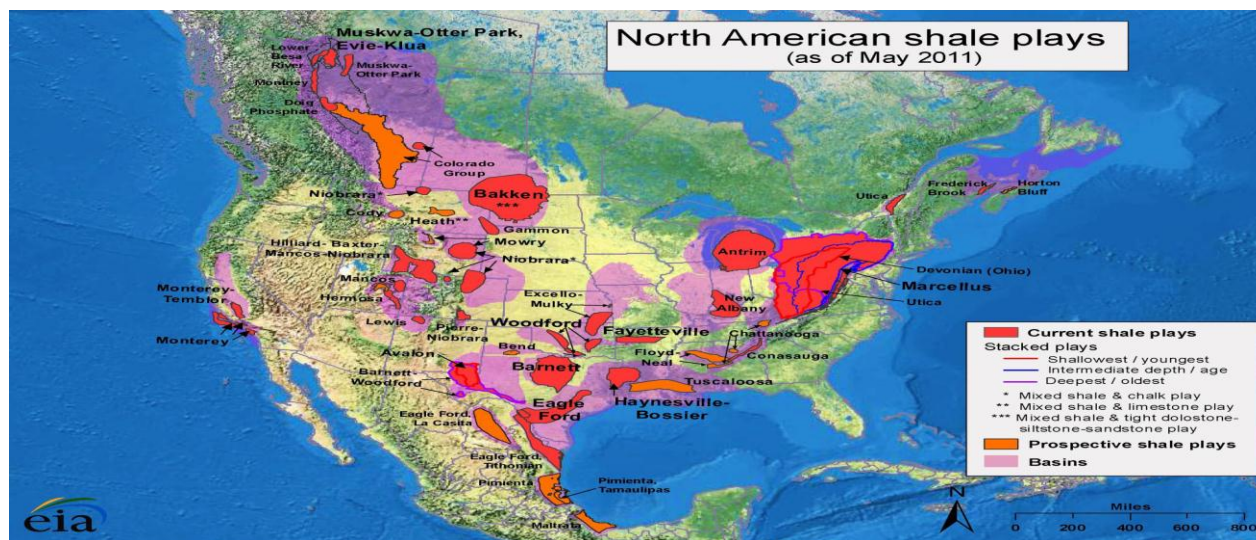
Рис. 1 – Сланцеві плеї Північної Америки.

На даний час найбільш інтенсивно сланцевий газ видобувається у США, тут оконтурено 37 газосланцевих плеїв, загальною площею більше 1 млн. км 2 [15], рис. 1.