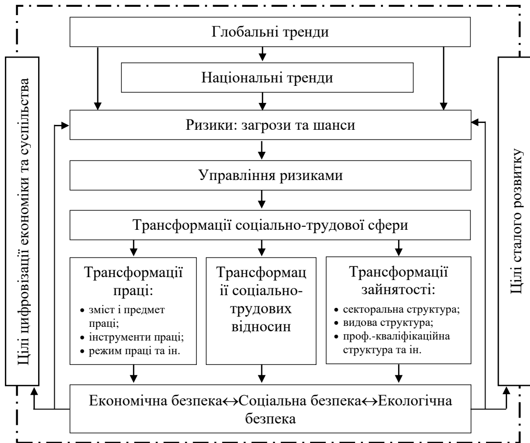
Рис. 1. Схема трансформації соціально-трудової сфери в умовах цифрового та сталого розвитку*

стає цифровізація економіки. Український ринок праці перебуває під дією цих глобальних трендів, які чинять потужний як прямий вплив, так і опосередкований у результаті вітчизняної специфіки соціально-економічного розвитку. По суті, вони формують нову реальність, що стає викликом традиційній системі гарантування соціальної безпеки. Трансформаціям піддаються гарантії стабільної повної зайнятості, система оплати праці, соціальний захист тих, хто працює, оформлення трудових відносин тощо. Означені зміни — це непрості, суперечливі та ризикові процеси, які одночасно генерують нові загрози й можливості (рис. 1).