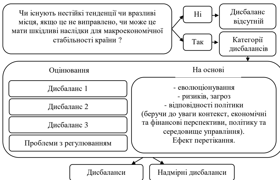
Рис. 3. Ідентифікація та оцінювання макроекономічних дисбалансів Алгоритм побудовано згідно Правил Макроекономічних дисбалансів [13].

На рисунку 3. представлено спрощений алгоритм визначення стану розбалансування системи чи з'ясування/констатацію відсутності дисбалансів.