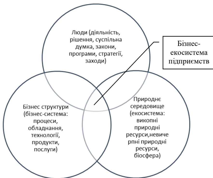
Рис. 1. Середовище формування бізнес-екосистеми