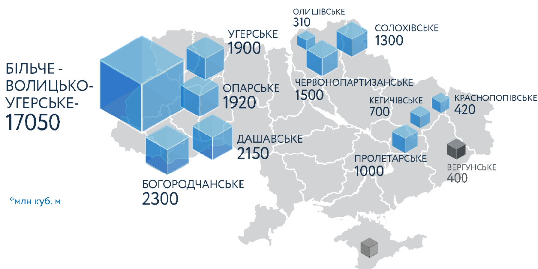
Рис. 2. Карта підземних сховищ газу в Україні

Також до складу АТ «Укртрансгаз» входять філії, що надають послуги з комплексного сервісного обслуговування, будівництва та капітального ремонту об'єктів газотранспортної галузі, зокрема: БМФ «Укргазпромбуд», ВРТП «Укргазенергосервіс», НВЦ ТД «Техдіагаз», Управління «Укргазтехзв'язок», Науково-дослідний інститут транспорту газу, Дирекція з будівництва та реконструкції ГТС. Разом з тим, ці структурні підрозділи входять до складу дивізіону «Технічне забезпечення» Групи Нафтогаз України. До 1 січня 2020 року АТ «Укртрансгаз» також управляло українською газотранспортною системою, однак після завершення анбандлінгу цю функцію здійснює незалежний Оператор ГТС України.