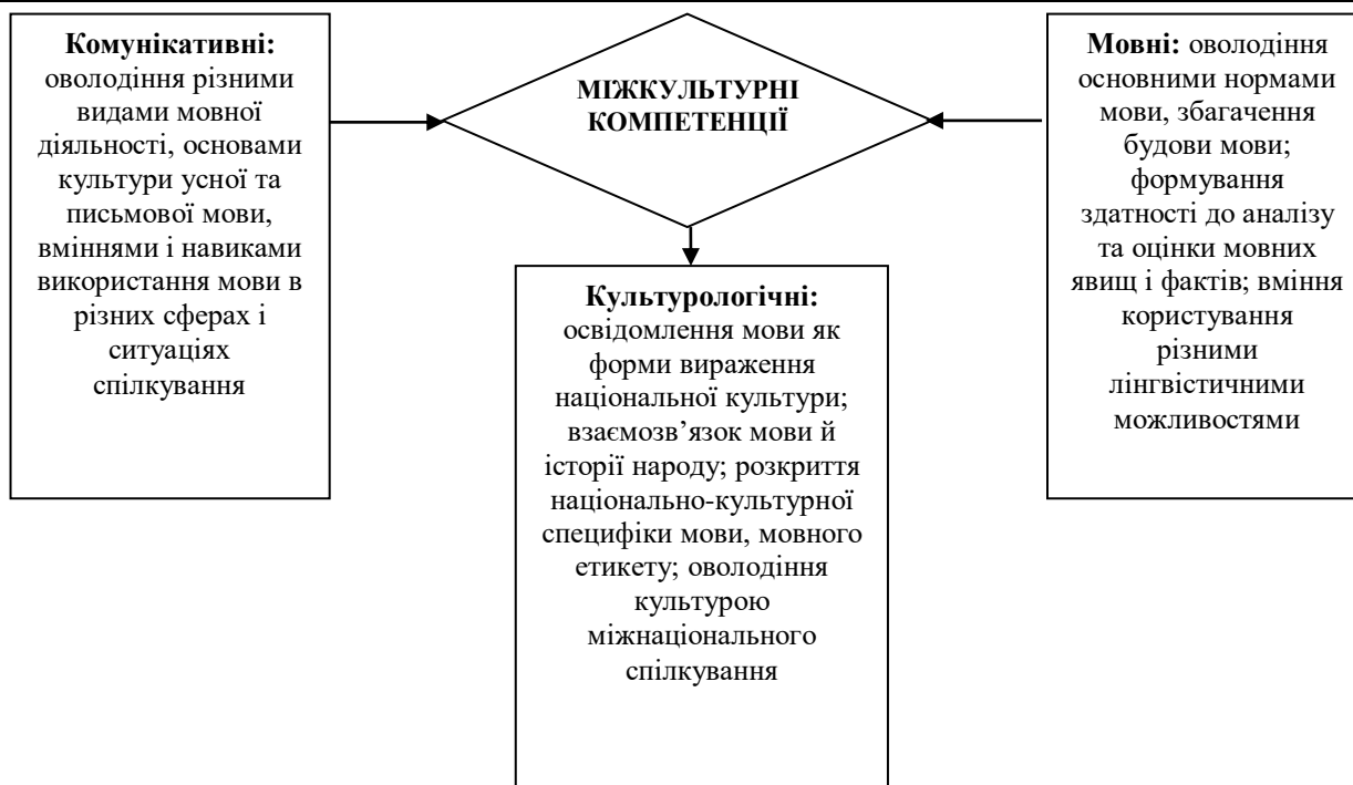
Рис. 1. Взаємозв'язок ключових мовних компетенцій