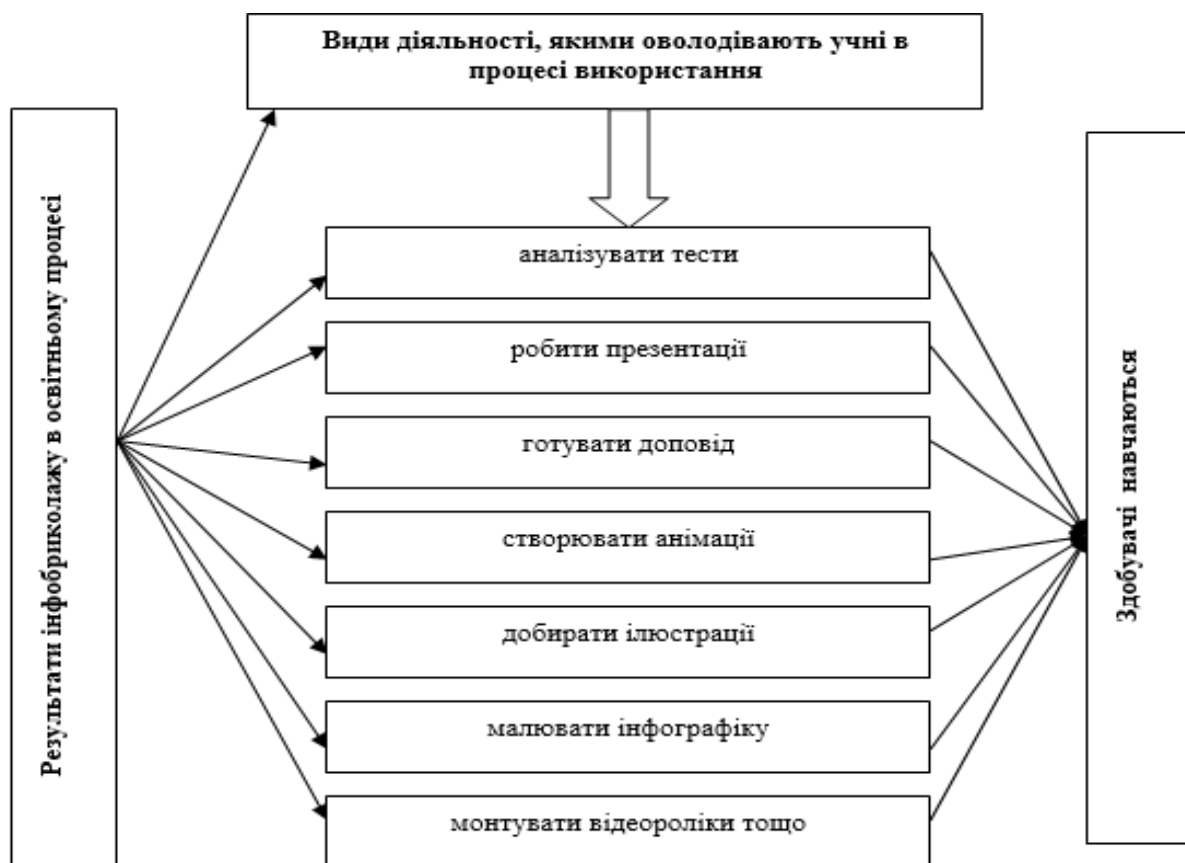
Рис. 3. Види діяльності, якими оволодівають здобувачі в ході бриколажного навчання

При цьому гармонійна взаємодія теоретичних і практичних аспектів слугує передумовою функціонування всіх освітніх ланок, діяльність яких має бути спрямована на реалізацію наступних функцій: