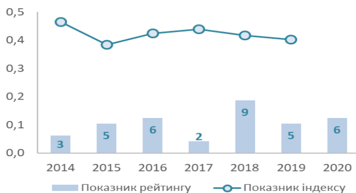
Рис. 1. Індекс Євроінтеграційного Поступу Івано-Франківської області за 2014 – 2020 роки [7-11]

З 2014 року Україна остаточно затвердила курс на європейську інтеграцію, що відобразилося у відповідних аналізованих параметрах області. З 2014 по 2019 роки показники ІСЄП по Івано-Франківській області показують тенденції до коливання, в 2014 році область посідала 3 позицію з показником 0,4642; в 2015 році – 5 позицію з показником 0,3845; в 2016 році – 6 позицію з показником 0,4237; в 2017 році – 2 позицію з показником 0,4384; в 2018 році – 9 позиція з показником 0,4168; в 2019 р. – 5 позицію з показником 0,4027, 2020 р. – 6 позицію з показником 0,5011. Як свідчить аналіз даних, найкращий період розвитку для Івано-Франківської області були 2014 та 2017 роки, несприятливим виявився 2018 рік, в якому область посіла 9 місце в загальноукраїнському рейтингу.