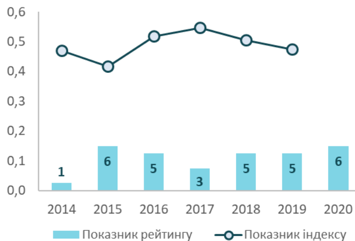
Рис. 2. Субіндекс глибини торговельно-економічних взаємозв'язків з ЄС Івано-Франківської області за 2014 – 2020 роки

В ході дослідження та аналізу виявлено, що місцеві органи влади та самоврядування недостатньо уваги приділяли оновленню інформації щодо заходів з впровадження/імплементатії окремих положень Угоди про асоціацію між Україною та ЄС в області. Інформаційна політика в області було на низькому рівні, не достатньо висвітлювались стейхолдерам можливості які дає Угода про Асоціацію. Таке ігнорування призвело до того, що мешканці краю, суб'єкти господарювання, громадські і просвітницькі організації не володіли актуальною інформацією.