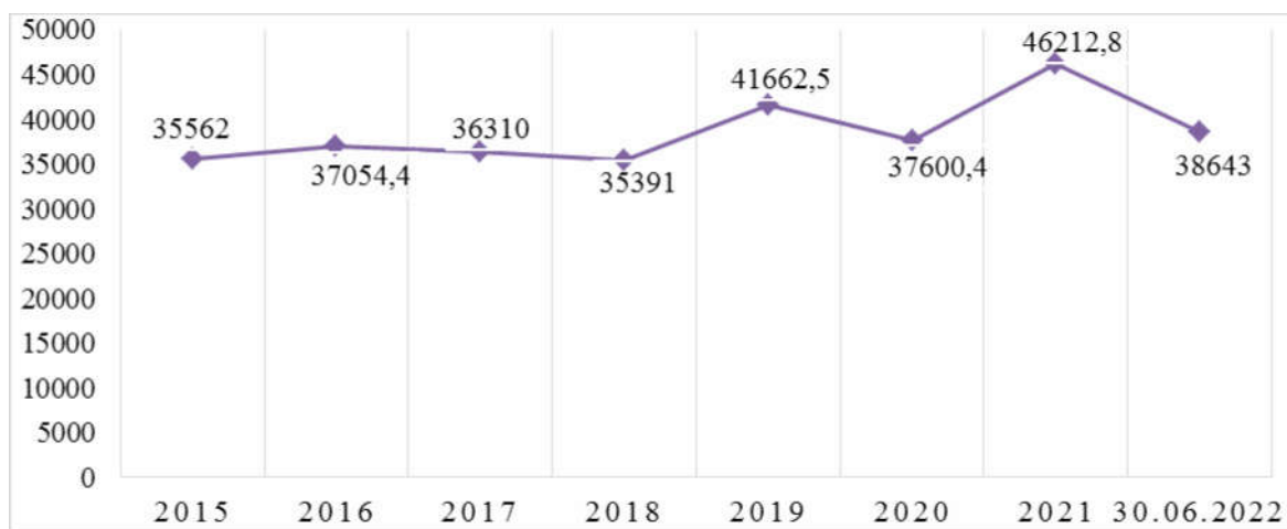
Рис. 1. Динаміка обсягів залучених прямих іноземних інвестицій в Україну у 2015-2022 рр. (млн. дол. США), складено за даними [10].

Динаміку обсягів залучених прямих іноземних інвестицій в Україну впродовж останніх років відобразимо на рисунку 1.