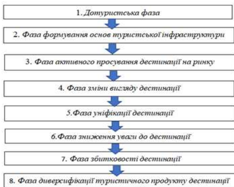
Рис. 2 - Фази життєвого циклу туристичної дестинації [9]

Окрім складових елементів туристичної дестинації та можливого оцінювання кожного з них, важливим є розуміння, на якому етапі життєвого циклу перебуває дестинація. Оскільки, вважаємо, що розгляд життєвого циклу дестинації та врахування цього фактора при оцінюванні ефективності туристичної дестинації є важливим з точки зору формування критеріїв оцінювання та величини можливого впливу на громаду/регіон. Зазначимо, що кожна дестинація проходить певний життєвий цикл, рисунок 2.